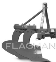
Плуг PRO 2.20