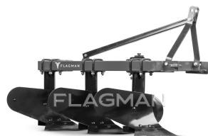
Плуг ЕКО 3.20