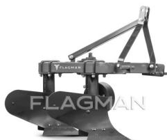
Плуг ЕКО 2.20